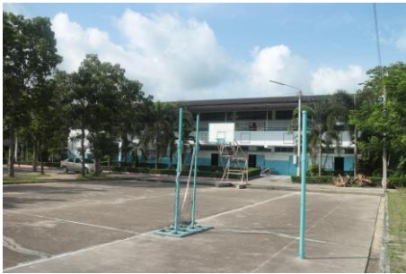
รูปภายในบริเวณสถานศึกษา 2