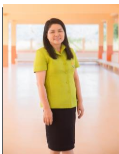
รูปรองผู้อำนวยการ 1