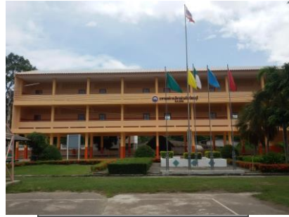
รูปภายในบริเวณสถานศึกษา 1