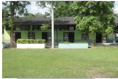
รูปภายในบริเวณสถานศึกษา 3