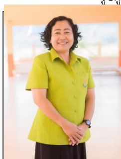
รูปรองผู้อำนวยการ 2