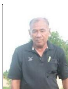
รูปรองผู้อำนวยการ 3