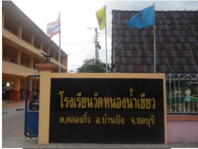
รูปด้านหน้าสถานศึกษา

สังกัดสพ.ชลบุรี เขต 1 กระทรวงศึกษาธิการ ปัจจุบันเปิดสอนระดับชั้น อนุบาล 1 - มัธยมศึกษาปีที่ 3