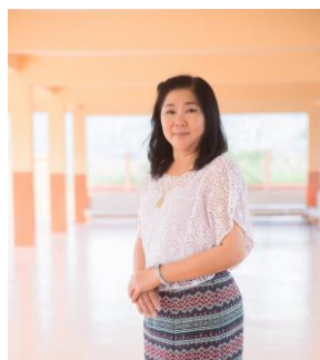
รูปผู้อำนวยการ